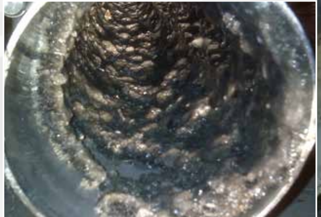
Verkrustungen in Rohren